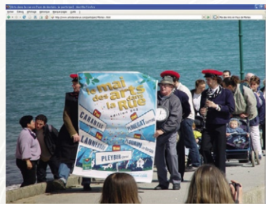
Carantec, 1 er mai 2002