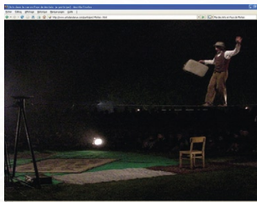
Saint-Martin-des-Champs, 11 mai 2001