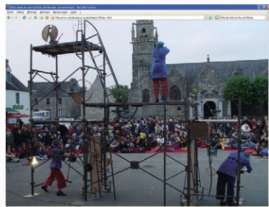
Pleyber-Christ, 18 mai 2002