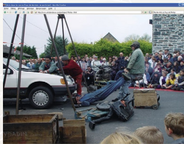
Lannéanou, 9 mai 2002

Chaque rendez-vous du « Mai des Arts » est également raconté en texte et en images par l'équipe de l'Espace Culture Multimédia du Fourneau sur le site :