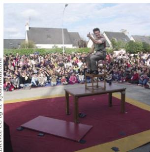
Le 1 er mai 2009, 16h16 : Henvic.

Depuis le 1 er mai, à l'initiative du Fourneau et de Morlaix Communauté, le théâtre de rue est en marche dans le Pays de Morlaix : 4 des 28 communes de Morlaix Communauté ont déjà pu goûter à l'occasion du Mai des Arts aux nouvelles créations de théâtre de rue. Des graines qui durant tout le mois de mai auront fait naître les premières émotions saisonnières.