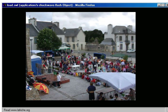
Montage, « Marchérama »

« Carte postale » réalisée par la cybercommune de Guerlesquin, en août 2004.