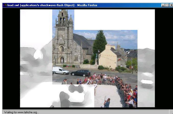
Montage, « Lancé de Menhirs »

Il y a d'abord le site qui propose un parcours aléatoire de l'espace public à l'espace privé, une ballade à travers des tableaux réalisés dans différentes villes. Ces tableaux sont impulsés par des groupes d'habitants formés pour l'occasion. SquarENet les invite à se former aux outils de captation son et image, à errer dans leur propre ville à la redécouverte de ses paysages, de sa population. Ce groupe, correspondant privilégié, travaille alors avec l'équipe de KXKM à enrichir le parcours proposé sur le site de nouveaux tableaux.