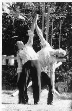
Trace ta route, Ratatouille et Raille ta trouille (Précédente création)

Cinq personnages se réunissent autour d'un repas. Où se retrouvent-ils ? Est-ce un pique-nique ou un dîner mondain, ou alors un déjeuner en terrasse ? La préparation comme une sorte d'apéritif serait une mise en bouche autant qu'une mise en danse et en musique. Le moment du repas arrive, festif, jubilatoire, mais aussi empreint de tensions, siège de déferlement des énergies, des règlements de compte, des grandes réconciliations ou des jeux de table... Comment cela se termine, qui fera la vaisselle, qui rangera les plats et passera le coup d'éponge ? Quelle est la suite pour ces personnages qui viennent partager avec le public une expérience atypique ?